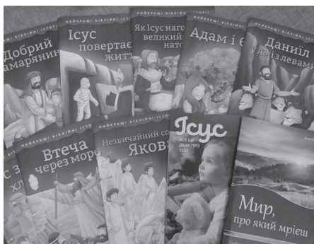
Книги, надруковані у Польщі

Дійсно, коли ми об'єднуємося в служінні Господу через співчуття і допомогу потерпілим, Господь може зробити дуже багато. Та найкраще, що Він робить, це зміни у наших серцях, наповнюючи їх співчуттям і любов'ю.