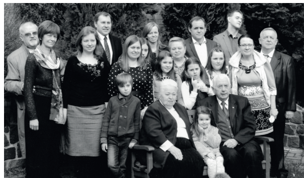
У дружньому родинному колі