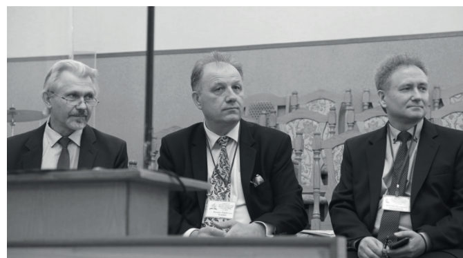
Дякуємо братам, керівникам Західної конференції 2014-2018 років