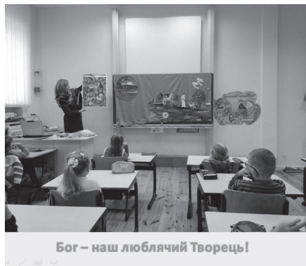
Бог – наш люблячий Творець!