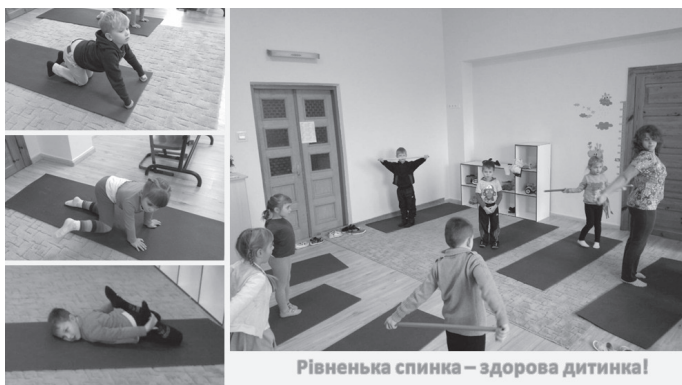
Рівенька спинка – здорова дитинка!