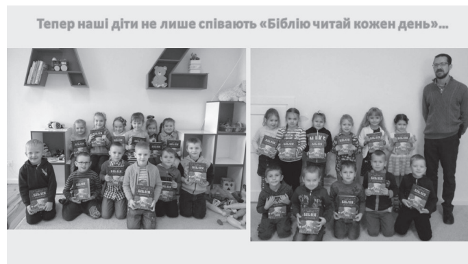
Тепер наші діти не лише співають «Біблію читай кожен день»...